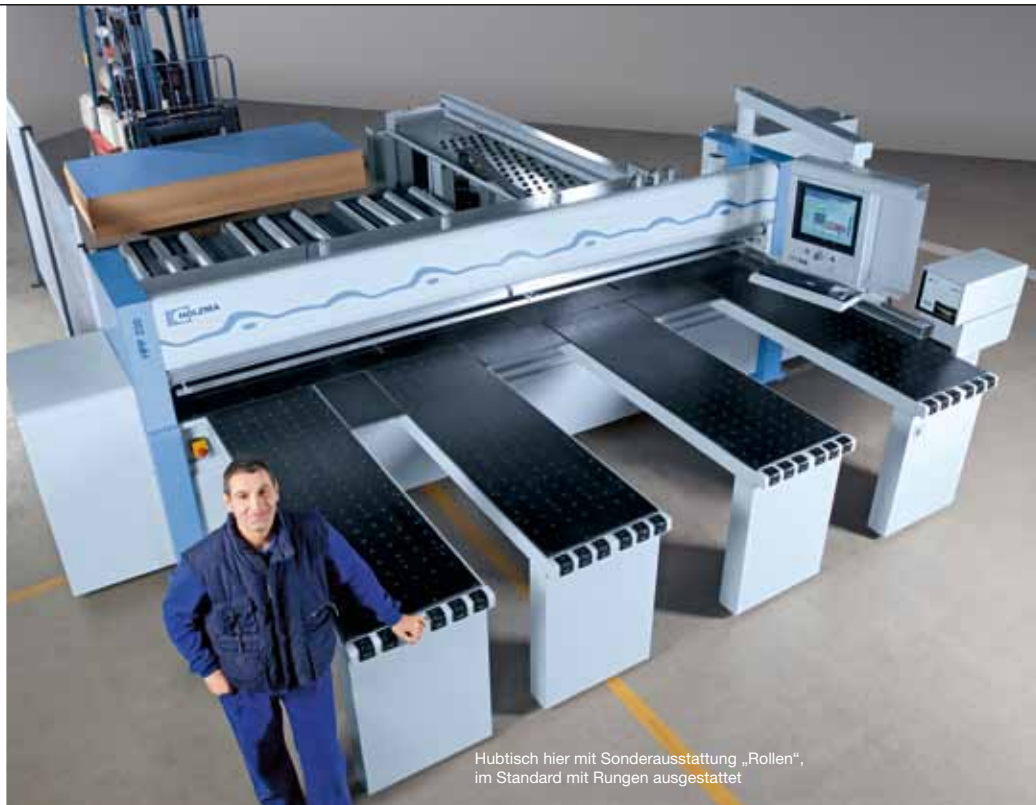
Hubtisch hier mit Sonderausstattung „Rollen“, im Standard mit Rungen ausgestattet