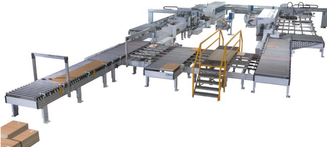
Bild 1: Kantenbearbeitung in Losgröße 1 Anlage mit automatischer Teileerkennung