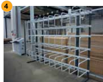
Die fertige Anlage nach dem Ausrichten