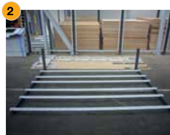
Vormontage der Horizontalträger