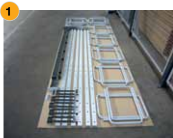
Einzelteile Resteregal ohne Fachböden

Zu dem Restemanagement bietet HOMAG Automation das passende Resteregal gleich mit an. Einfach im Aufbau und variabel erweiterbar ist das Resteregal frei im Raum platzierbar und bietet viel Spielraum für die platzsparende Lagerung von kleinteiligen Materialresten.