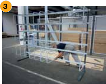
Verschrauben der Rohrbügel