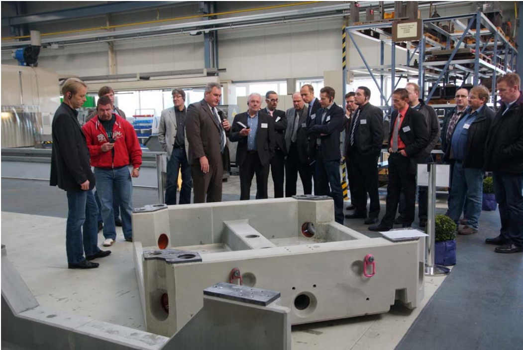
Bild 6: Rundgang durch die Produktion von BÜTFERING Schleifmaschinen; auf dem Bild ein Maschinenbett aus dem schwingungsabsorbierenden Werkstoff SORB TECH.