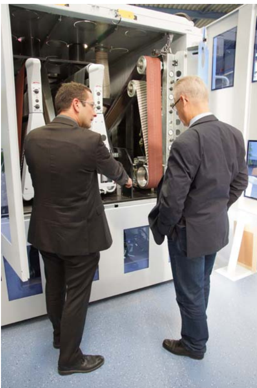
Bild 7: Ebenfalls im neuen CompetenceCenter vertreten: Schleiftechnologie von BÜTFERING