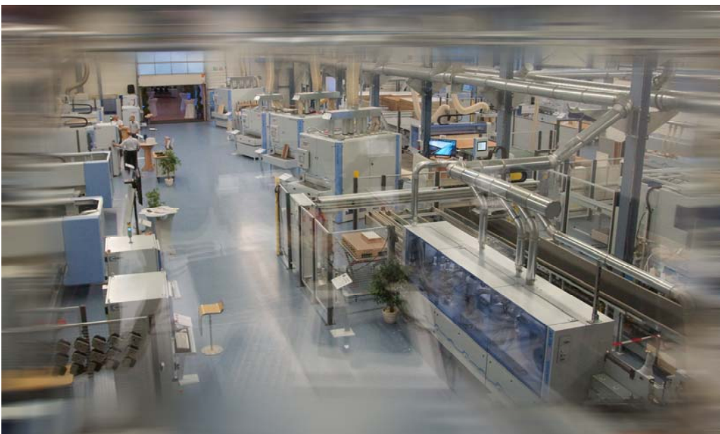
Bild 3: HOMAG Group CompetenceCenter Info-Treff am 21.11.2012