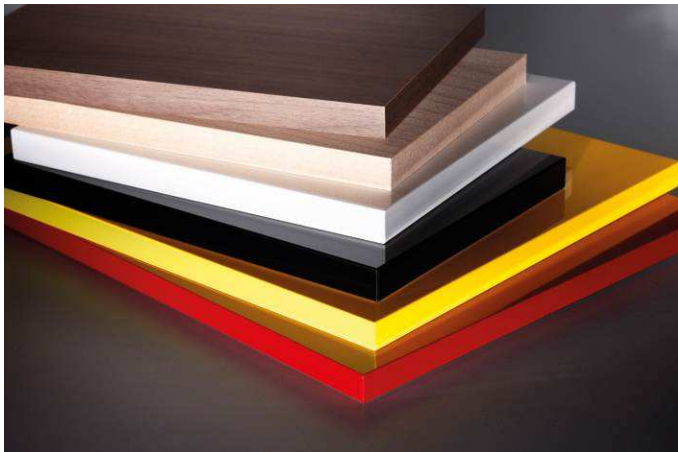
Bild 3 a und b: Mit airTec zeigt die HOMAG Group die Nullfugenlösung für das Handwerk