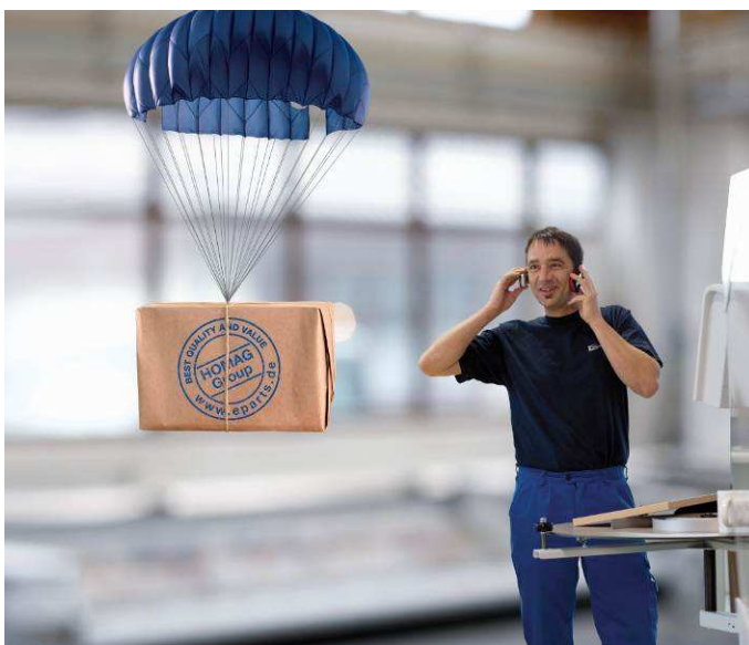
Bild 4: HOMAG Group Ersatzteile werden weltweit schnell und sicher versandt: Bestellung unter www.eparts.de