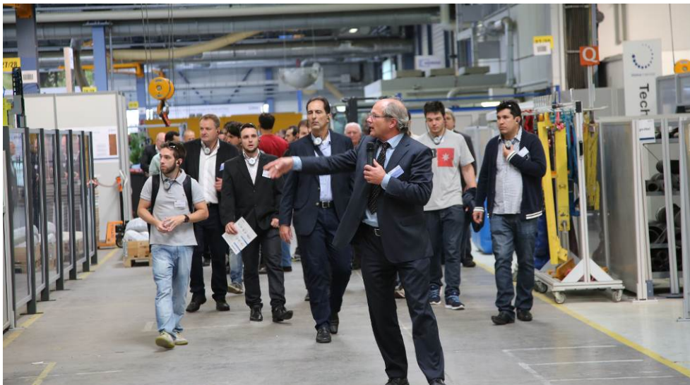
Bild 2: Ein großer Anteil der Besucher reiste aus dem internationalen Raum zu den HOMAG Group Treffs