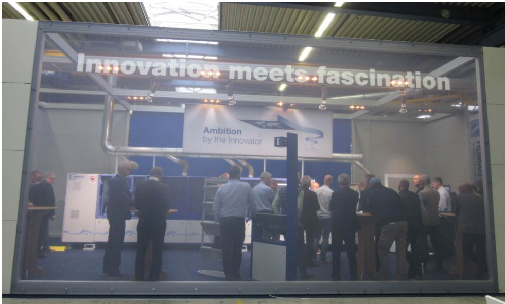
Bild 1: In der TECBox präsentierte HOMAG das Messehighlight: Die neue Ambition-Baureihe