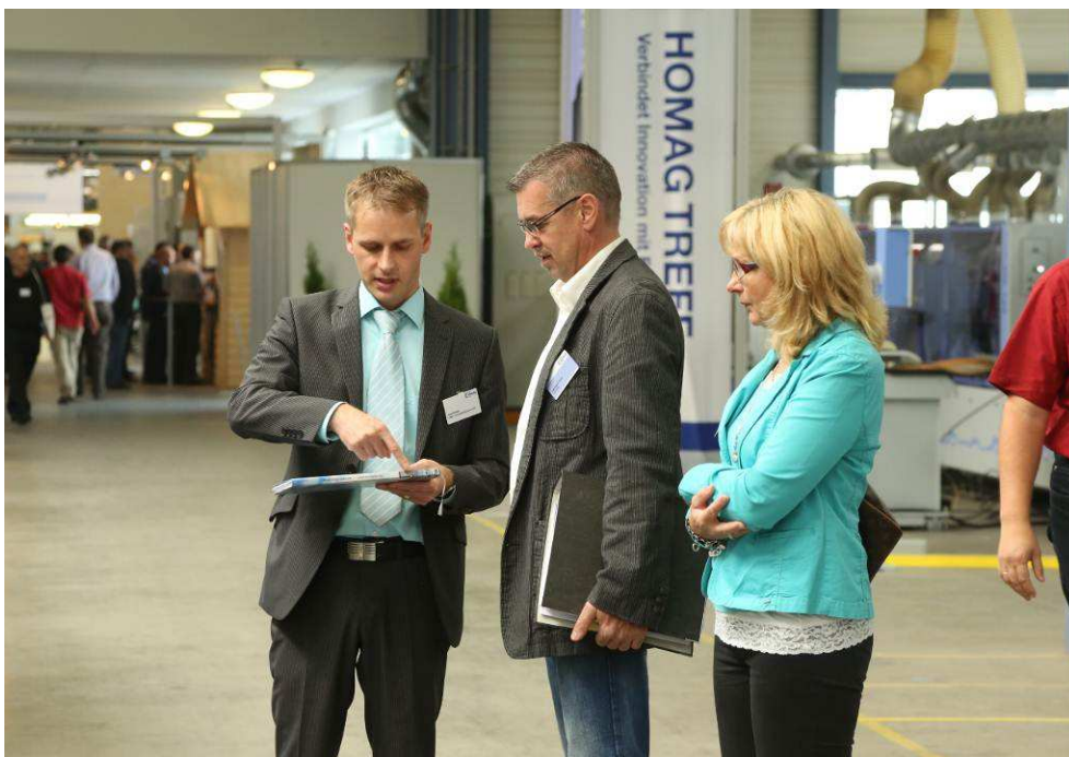
Bild 4: Persönliche Gespräche und der enge Kontakt zu Kunden stehen bei den Treffs im Fokus