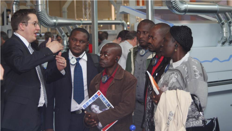
Bild 5: Eine Besuchergruppe aus Gabun nach langer Reise angekommen in der HOMAG City