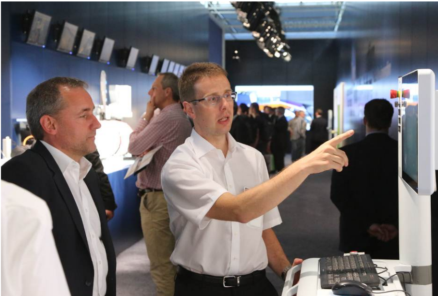
Bild 1: powerTouch – die neue Dimension der Maschinenbedienung im legendären InnovationCenter