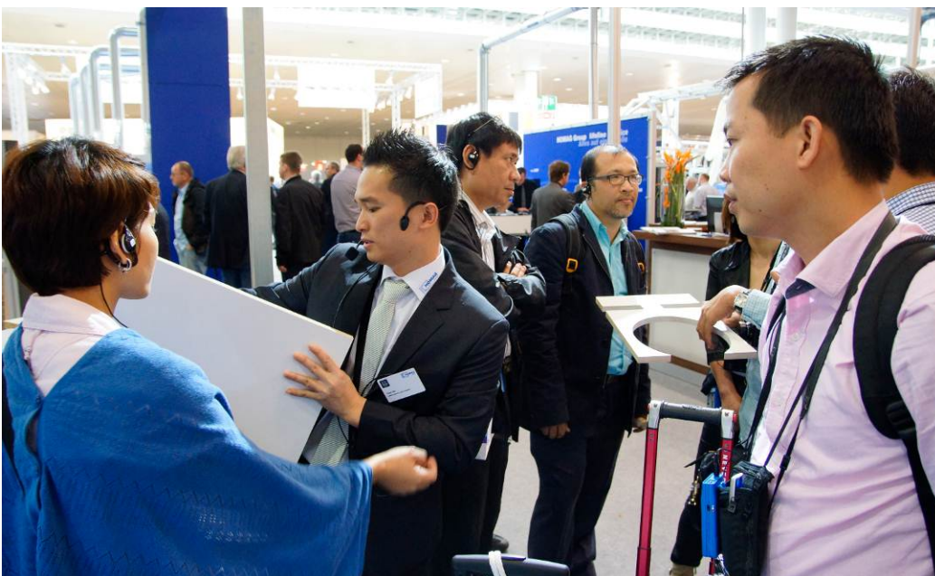
Bild 4: Internationale Messe: Rund 56 % der Besucher der HOMAG City reisten aus dem internationalen Raum an